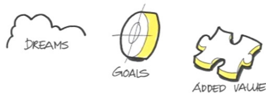
Figuur: Strategisch venster SVP-CN