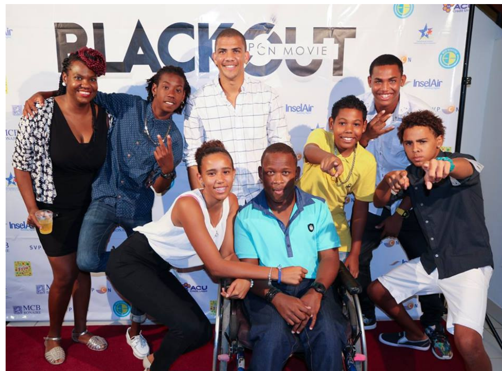
Preventiefilm en acteurs "Black out"